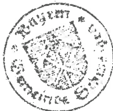
Hubert Mangold 1. Bürgermeister